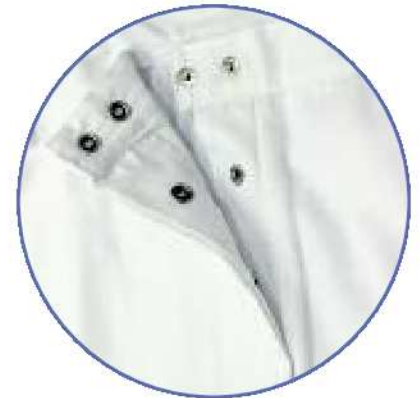
Hosenschlitz mit Druckknopfverschluss