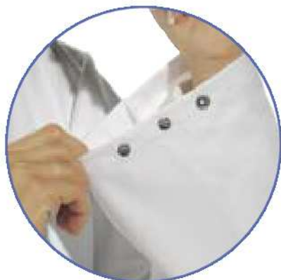
verstellbare Ärmelweite durch Druckknopfverschluss