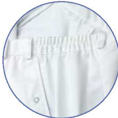
Dehnzone im Bund