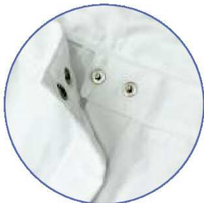
verstellbare Bundweite durch zwei Druckknöpfe