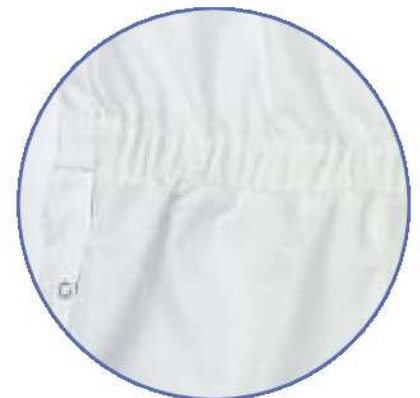
Dehnzone im Rücken