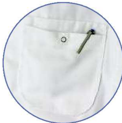
innenliegende Taschen mit Druckknopf verschließbar